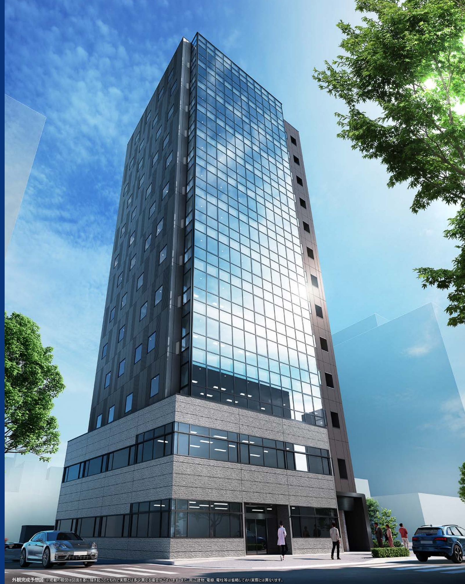
外観完成予想図 ※掲載の絵図は図面を基に描き起こしたもので実際とは多少異なる場合がございます。また、周辺建物、電線、電柱等は省略しており実際とは異なります。