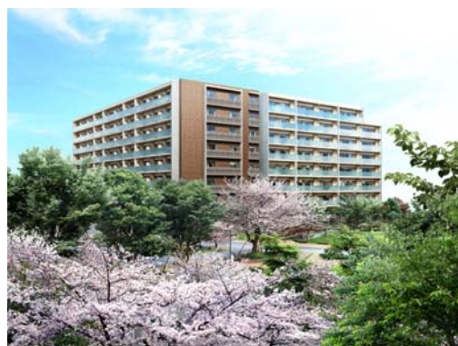
建物外観完成予想CG