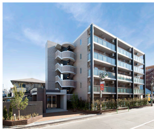
<外観写真> 上石神井テラス（売却済み）

当社の多角的な事業展開の一つとして注力している賃貸マンション開発事業「テラス」シリーズは、第1号物件として「上石神井テラス」（東京都練馬区／総戸数24戸）が2014年に竣工。以降、これまでに6物件（171戸）が竣工しています。竣工後は、当社において保有・賃貸する一方、市場ニーズに応じてREIT・ファンド等の投資家への一棟売却も行っています。