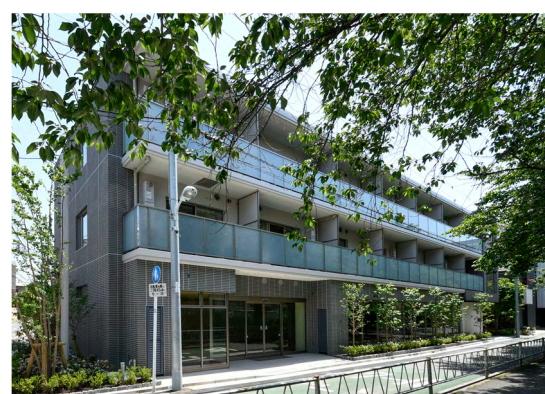
テラス都立大学 (当社で保有・賃貸中)