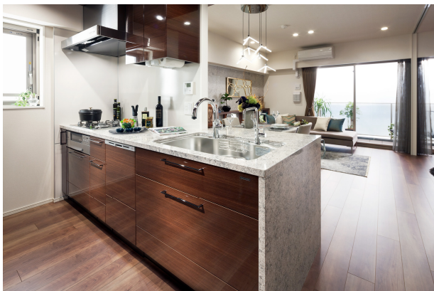
<当社オリジナルキッチン>