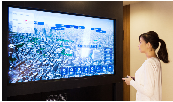
「REAL 3DMAP TOKYO for VR」利用シーン

3次元都市データ「REAL 3DMAP TOKYO for VR」で立地の良さを体感！