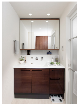
<当社オリジナル洗面台>