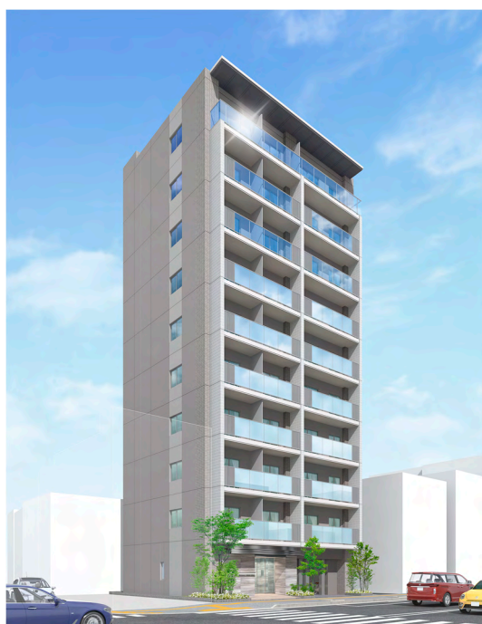
<テラス南千住> 外観 CG

本物件のデザインコンセプトを「Stylish Modern（スタイリッシュ モダン）」とし、ファサードデザインは都会的で瑞々しい印象を与えるクールな色調の仕上げ・マテリアルで構成。エントランス周りにはアイキャッチとなるカツラの木をはじめとした植栽を配し、安らぎと洗練された空間を演出しています。