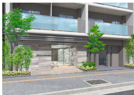
<テラス南千住> エントランス CG