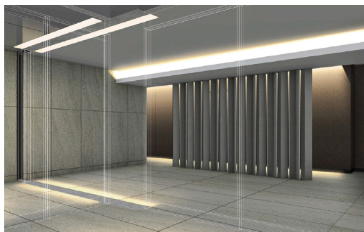
完成予定 CG (エントランス)

「テラス横浜鶴見」は新築賃貸マンションブランド「テラス」シリーズ25棟目で、初めて神奈川県横浜市内に誕生します。また、戸数としては当社過去最大規模の物件となります。