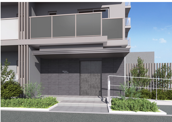
完成予定 CG（エントランス正面）