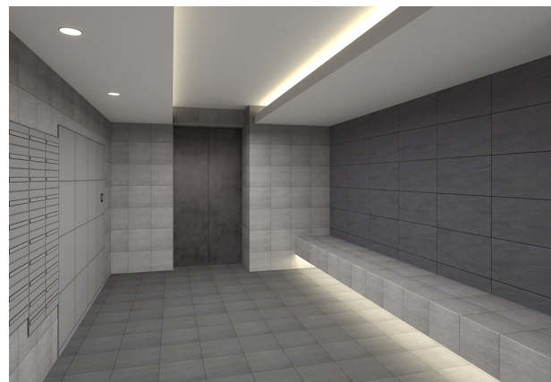
完成予定 CG（エントランス内部）