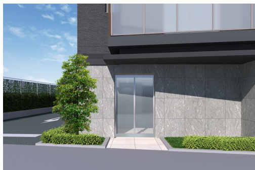
完成予定 CG (エントランス)

壁式プレキャスト鉄筋コンクリート工法による集合住宅建設のパイオニア、大成ユーレック株式会社が設計・施工を担当。大成建設グループ企業が連携し取り組むプロジェクトです。新築賃貸マンション「テラス」シリーズにおける同社の施工実績は、「テラス亀戸平井」で13物件目となります。